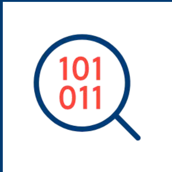
Analyse + Simulation